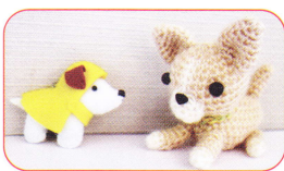
手づくりショップ 会員による作品