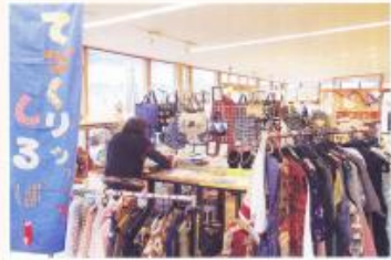
手づくりショップするばー (くろまろの郷 販売)