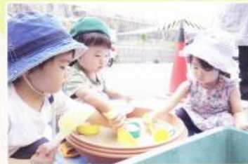
子ども一時預かり —にこにこルーム—