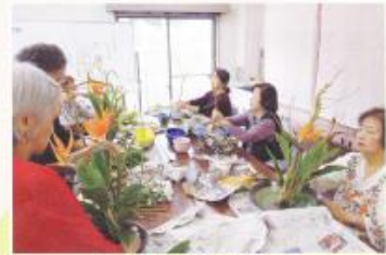
いけばな教室 —花園会—