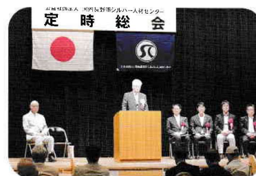
理事長、事務局長とご来賓の皆様