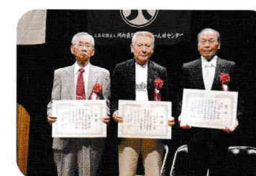
安全就業標語 表彰