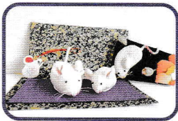
てづくりショップ 会員による作品

結びにあたり、本年が皆様にとりまして、素晴らしい年になりますことを祈念申し上げます、新年のごあいさつと致します。