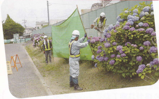
除草作業～寺ヶ池公園にて～