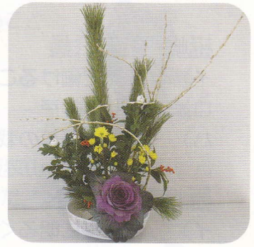
生け花教室～花園会～