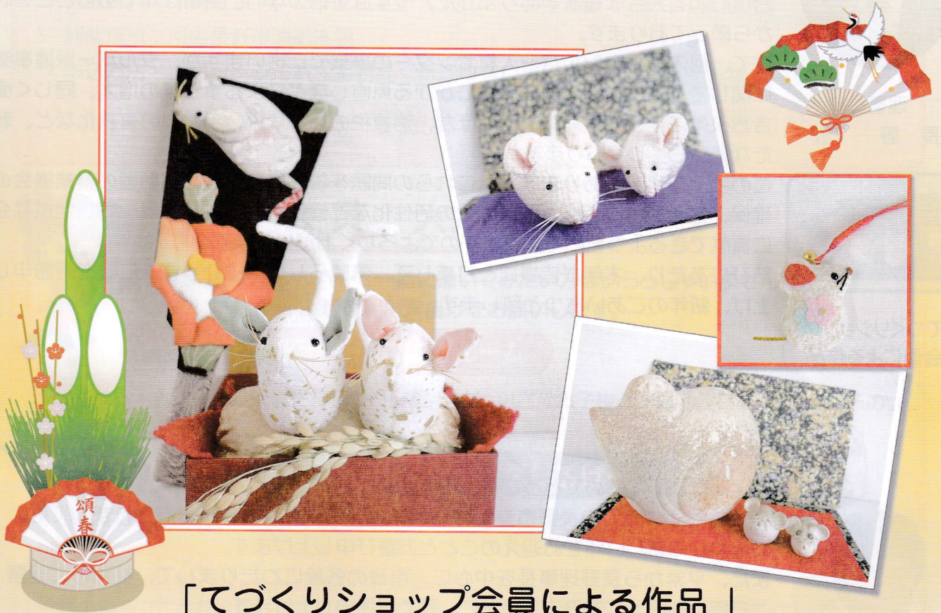
「てづくりショップ会員による作品」