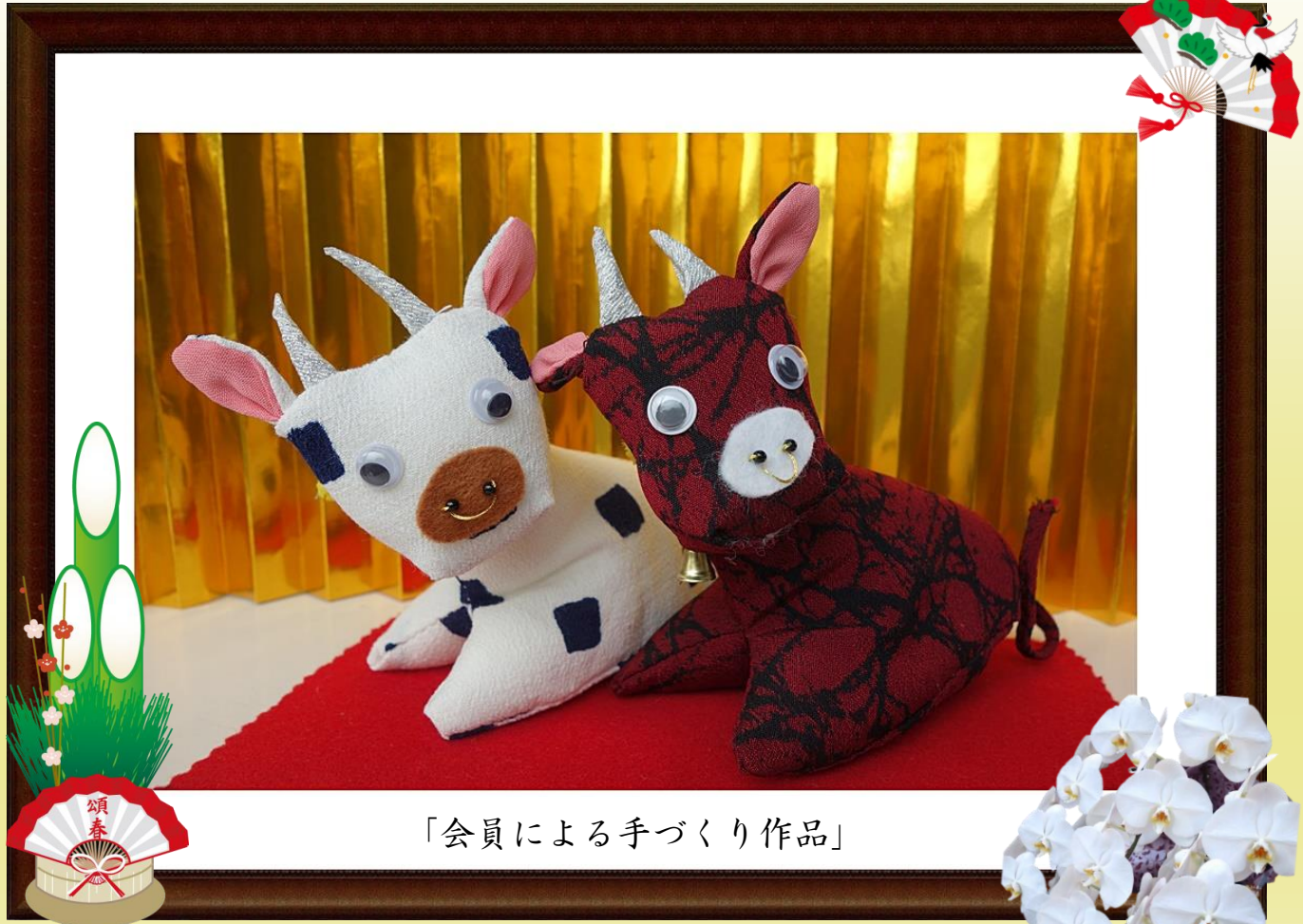
「会員による手づくり作品」