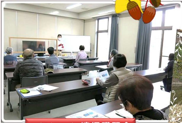
マンション清掃講習会