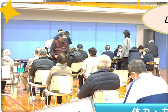
体力・カラダ測定会