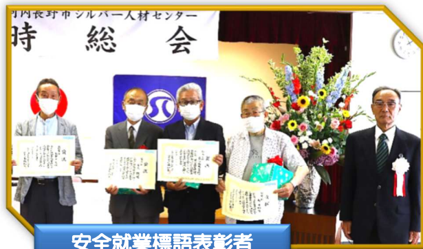
安全就業標語表彰者